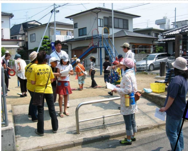
平成18年6月3日に行われた、帯西ウォークラリーです！

去年第3回目は新機軸で「P・T・Aの友愛セール」との共催で開催し、結果オーライに終わりました。それで今年も新メニューを考えておりますので、校区の皆さんにも「まつりのアイデア」を事務局あて(電話三八一〇五三六)までお寄せ下さい。