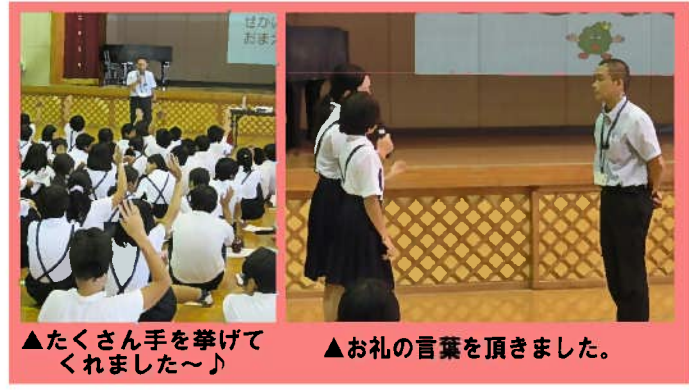
▲たくさん手を挙げてくれました～♪ ▲お礼の言葉を頂きました。

ーを頂くとともに、子ども達の純粋な心に癒されます。今年度は、帯山小学校と帯山西小学校でも認知症キッズサポーター養成講座を開催する予定です。認知症サポーター養成講座を受けてみたいと思われている方がいらっしゃいましたら是非、ご参加お待ちしております。お気軽にささえりあ帯山までご連絡ください。