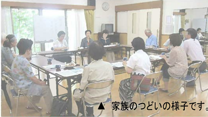
▲ 家族のつどいの様子です。

に開催予定です。認知症高齢者の介護家族の方、是非一度お気軽に参加されてみて下さい。