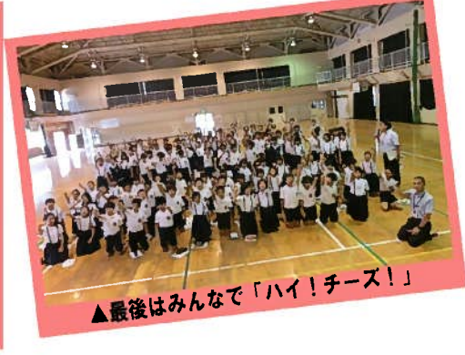
▲最後はみんなで「ハイ!チーズ!」